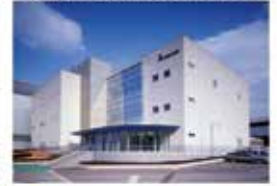
秩父昭和電工株式会社 〒369-1893 埼玉県秩父市下影森1505番地

エレクトロニクス分野で未来を拓く LED素子、LEDエピタキシャルウェーハ、 レアアース磁石合金など、エレクトロニクス関連の 多様な製品群を幅広い産業分野にお届けしています。